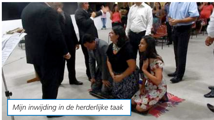
Mijn inwijding in de herderlijke taak