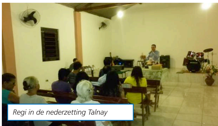
Regi in de nederzetting Talnay